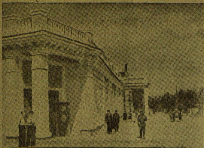
Камеиц-Подольская область. Новое здание концертного зала на 600 мест в гор. Проскурове.